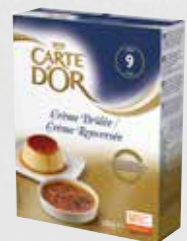
Carte d'Or Crème Brûlée

Variera din dessertmeny! Om du har återkommande gäster, så är det bra att växla dessert några gånger i veckan.