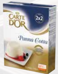
Carte d'Or Pannacotta

För den lilla extra touchen addera lite riven vit chocklad över Pannacottan, serverad med färska bär i en liten äggkopp.