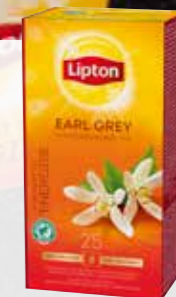
Lipton Earl Grey

När du adderar små mervärden till teet kan du ta ut ett högre pris. Det kan exempelvis vara eleganta glas och koppar.