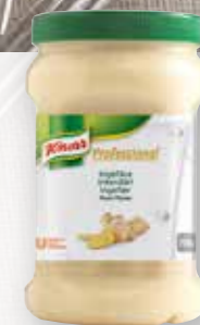
Knorr Professional Ingefära Kryddpuré

Prova Knorr Professional Ingefära Kryddpuré - ypperlig som smaksättare till alla typer av asiatiska maträtter.