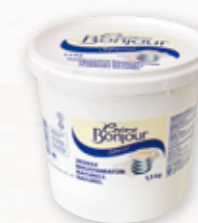
Crème Bonjour Naturell

Att servera fler och mindre mackor skapar en spännande och smakrik upplevelse och ger nyfikenhet.