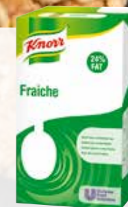
Knorr Fraiche 24 %

Använd som crème fraiche. Klarar höga temperaturer och passar till all varm matlagning. Fungerar med syrliga ingredienser. Perfekt för kalla såser, dressingar och smörgåsar.