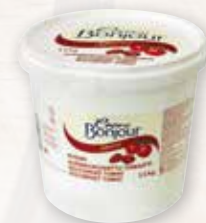
Crème Bonjour Soltorkad Tomat

Tänk också på de goda tillbehören som lyfter smak- erna på Crème Bonjour färskosten till nya höjder!