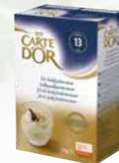
Carte Dór Vit chokladmousse

Våra Carte Dór produkter är tacksa- ma, vispa bara upp en sats och servera med lite färska bär. Snabbt, gott och enkelt.