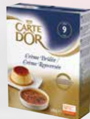
Carte d'Or Crème Brûlée

Toppa med säsongens bär och variera din dessert från vecka till vecka med små medel. Snabbt, kreativt och lönsamt.