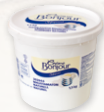
Crème Bonjour Naturell

Crème Bonjour är perfekt som smaksättning i både varm och kall matlagning och som pålägg på bröd.