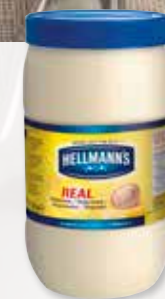
Hellmann's Real Majonnäs

Hellmann's Real Majonnäs blir inte rinnig när den används tillsammans med syrliga ingredienser eller i varma rätter.