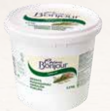
Crème Bonjour Gräslök

Brioche är en fransk klassiker, luftig och god med massor av möjligheter. Passar även utmärkt för att skapa desserter.