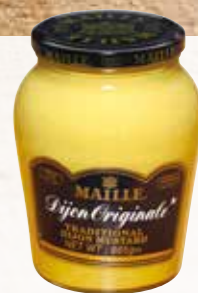
MAILLE Senap Dijon Original

Servera på spännande tallrikar/brickor för att överraska.