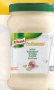
Knorr Professional Vitlökspuré

Pesto håller ca en vecka och kan användas till mycket.