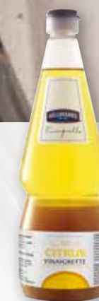
Hellmann's Citrus Vinaigrette

Hellmann's Vinaigrette kan användas till mer än salladsdressing – t ex sås, marinad, dekoration och dessert.