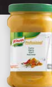
Knorr Professional Curry Kryddpuré

Tillsätt 1 matsked (50 g) till 1 l vätska. Professional purée kan läggas till sent i tillagningsprocessen, strax före servering eller i kalla rätter, till skillnad från torra örter och kryddor som behöver tid för att återfukta och mjukna.