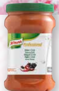
Knorr Professional Rökt Chili Kryddpuré

Knorr Professional Rökt Chili Puré är ett lättare sätt att smaksätta. Ger dig omedelbar smak i såser och dressingar.