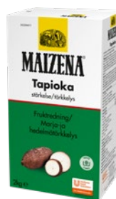
MAIZENA Tapioka, 4 x 2 kg Art.nr 67270042