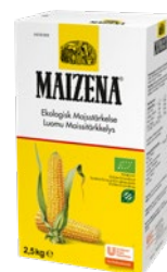
MAIZENA Ekologisk Majsstärkelse, 4 x 2,5 kg Art.nr 14472101

Blanda majsstärkelsen i en liten mängd kall vätska och tillsätt sedan blandningen i kokande vätska. Låt koka i ca 1 min.