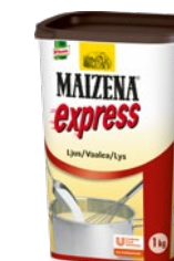
MAIZENA Express, ljus snabbredning, 6 x 1 kg Art.nr 13300902