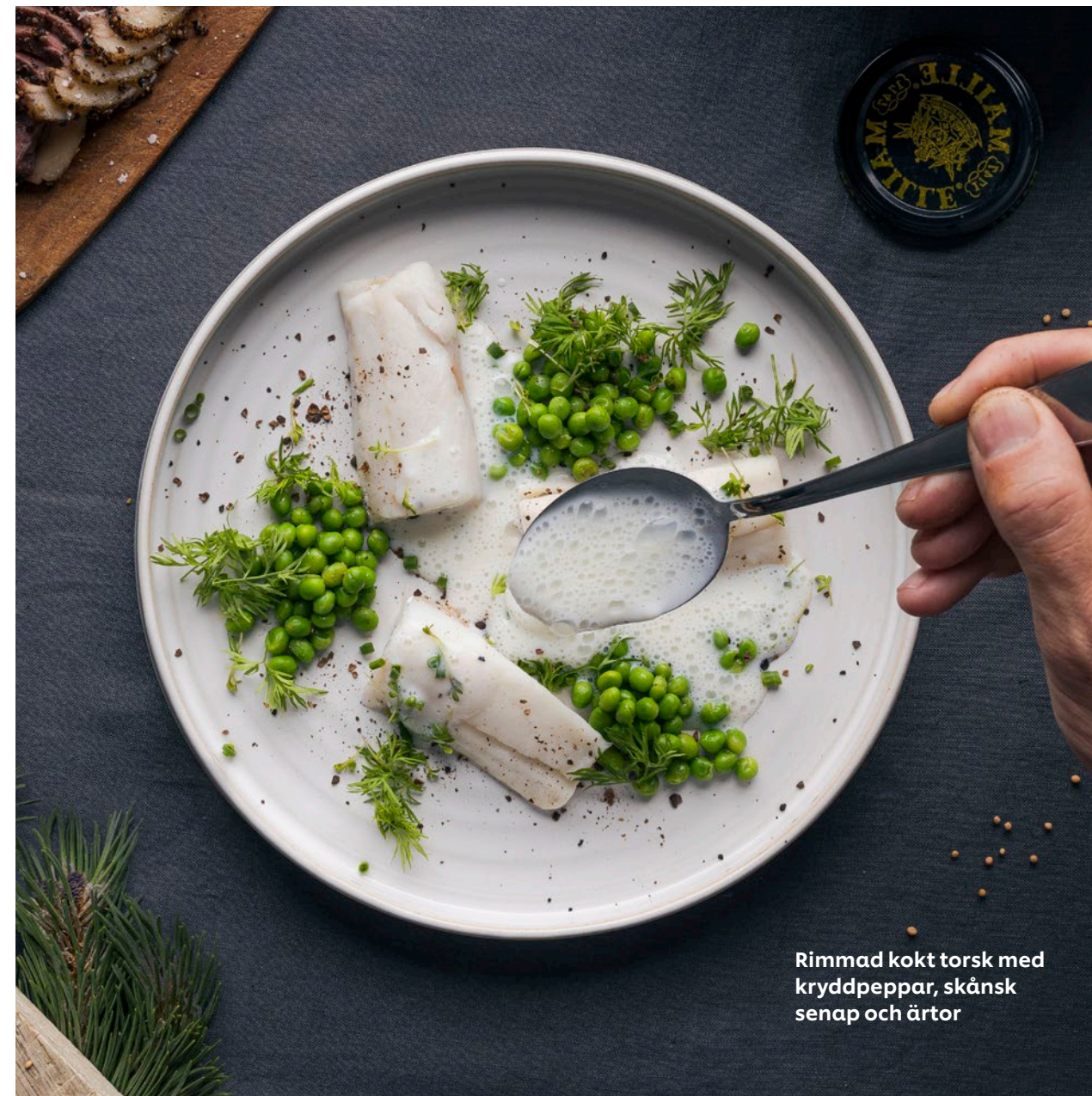
Rimmad kokt torsk med kryddpeppar, skånsk senap och örter