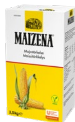
MAIZENA Majsstärkelse, 4 x 2,5 kg Art.nr 311313