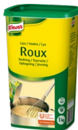
KNORR Roux ljus redning, 6x1 kg Art.nr CP0012455

Energi.....2380 kJ Protein.....5,3 g Fett.....38 g Kolhydrater ..... 47 g