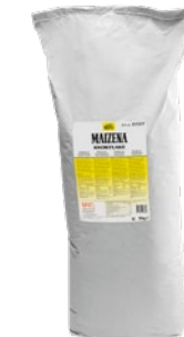
MAIZENA Snowflake, modifierad stärkelse, 1 x 10 kg Art.nr 311317