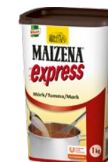
MAIZENA Express, mörk snabbredning, 6 x 1 kg Art.nr 13300802