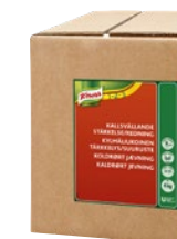
Knorr Cold Base Stärkelse Redning, 2 x 2 kg Art.nr 67340535

Görs såsen i stor volym: Börja med 30 % kall vätska, rör på högsta hastighet (ej växelvis) och tillsatt redning och resterande vätska succesivt.