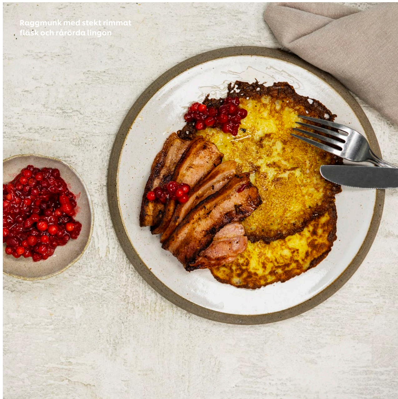
Raggmunk med stekt rimmat fläsk och rårörda lingon