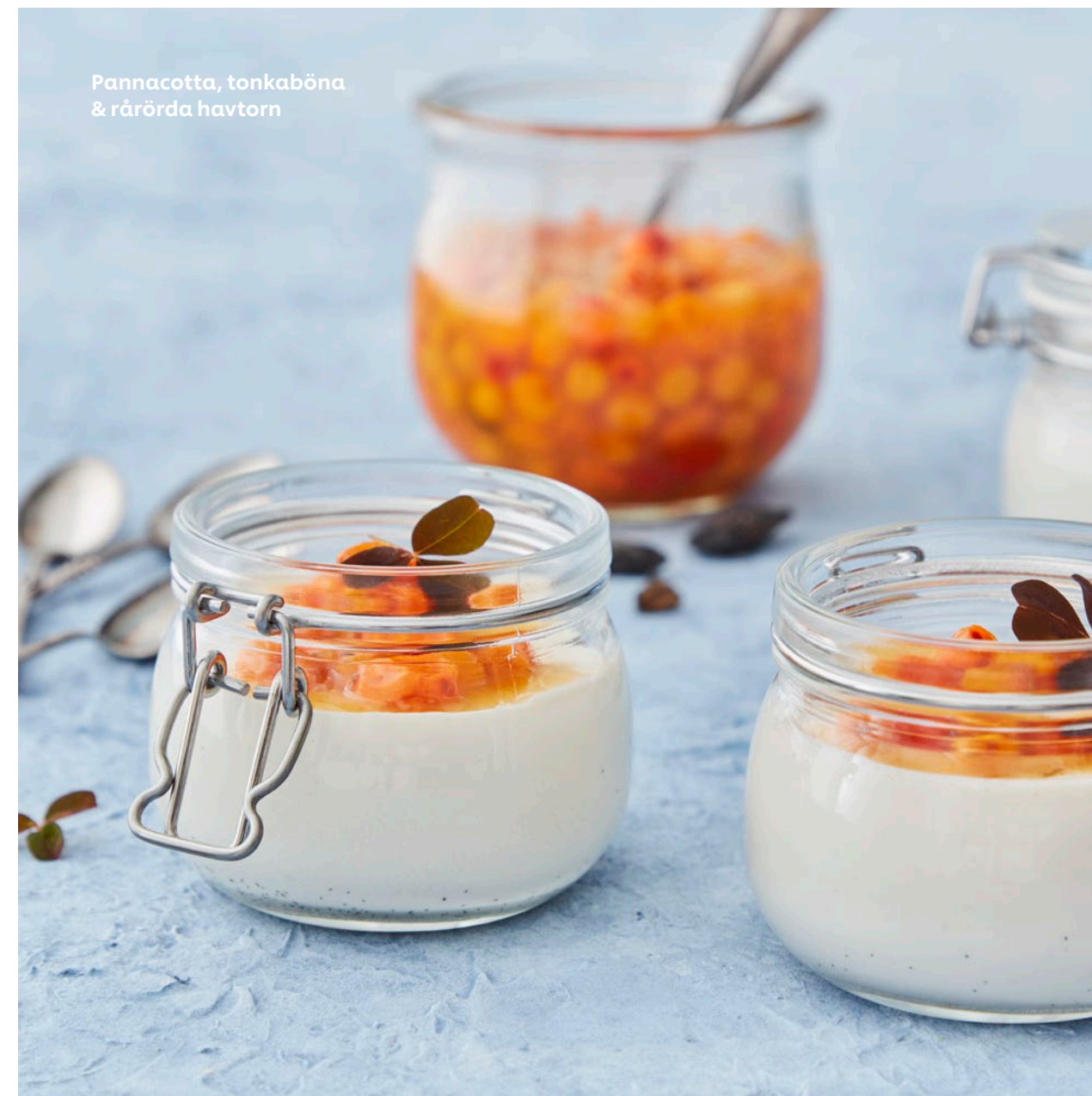
Pannacotta, tonkaböna & råörda havtorn