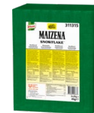
MAIZENA Snowflake, modifierad stärkelse, 2 x 2 kg Art.nr 311315