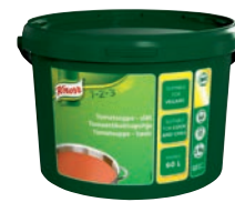
Knorr Tomatsoppa, slät

Art nr: F76312, 1 x 3,9 kg Spädning: 1 x 60 l Blandas enbart med vatten. Fri från MSG, gluten och laktos. Bain Marie-stabil och lämplig för att koka upp och sedan kyla ner. UHM 10886, Spjutspets, Certifierad palmolja UHM 10887, GMO fri vara