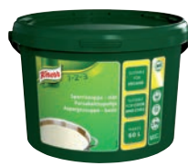
Knorr Sparrissoppa, slät

Art nr: F76895, 1 x 3,9 kg Spädning: 1 x 60 l Blandas enbart med vatten. Fri från MSG, gluten och laktos. Bain Marie-stabil och lämplig för att koka upp och sedan kyla ner. UHM 10886, Spjutspets, Certifierad palmolja