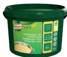
Knorr Kycklingsoppa, slät

Art nr: F76895, 1 x 3,9 kg Spädning: 1 x 60 l Blandas enbart med vatten. Fri från MSG, gluten och laktos. Bain Marie-stabil och lämplig för att koka upp och sedan kyla ner. UHM 10886, Spjutspets, Certifierad palmolja