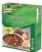
Knorr Gulaschsoppa, Österrikisk

Art nr: 17352002, 2 x 1,5 kg Spädning: 2 x 3 l