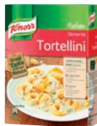
Knorr Tortellini med tomat/örtfyllning

Art nr: 311267, 1 x 5 kg UHM 10887, GMO fri vara UHM 10886, Spjutspets, Certifierad palmolja