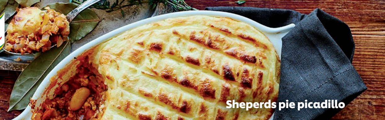
Sheperds pie picadillo