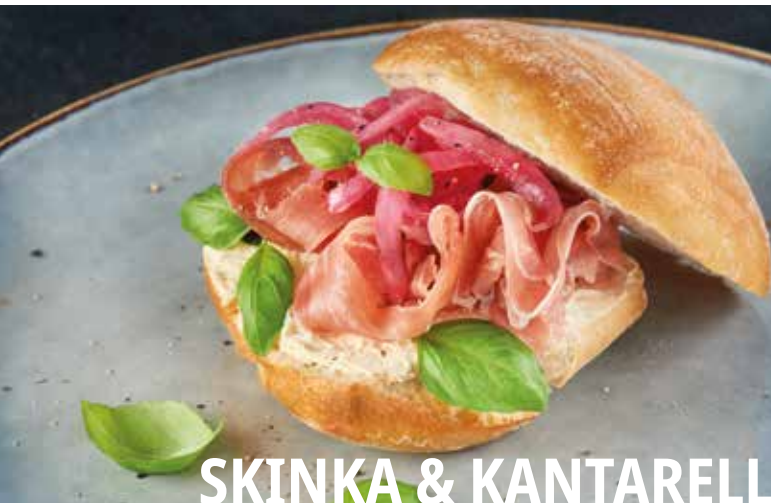
SKINKA & KANTARELL