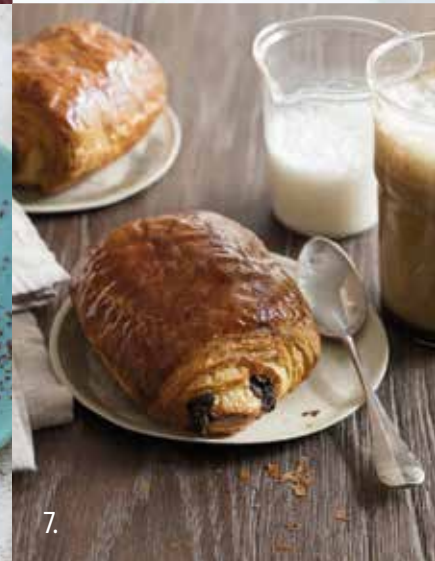
1. MUFFINS LYX FYLLD CHOKLAD/HASSELNÖTS CREME [78838] 2. PAIN AU CHOCOLAT TRIPLE [27245] 3. DONUT MED CHOKLADSMÅK [S2238] 4. SKAL CHOKLAD [78448] 5. CHOKLADFONDANT MINI [74672] 6. CHOKLADFONDANT [74517] 7. PAIN AU CHOCOLAT [S0851]