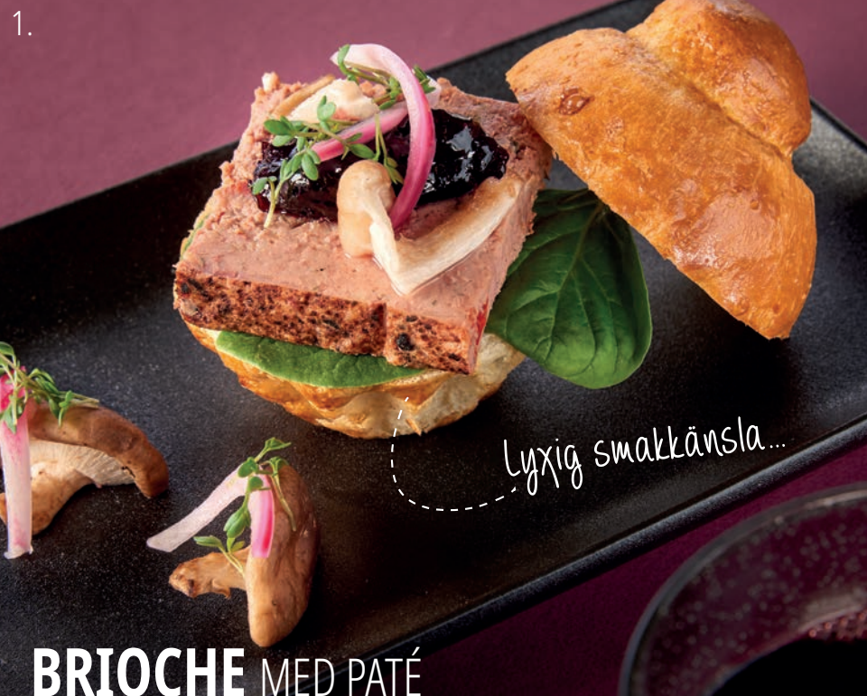
BRIOCHE MED PATÉ