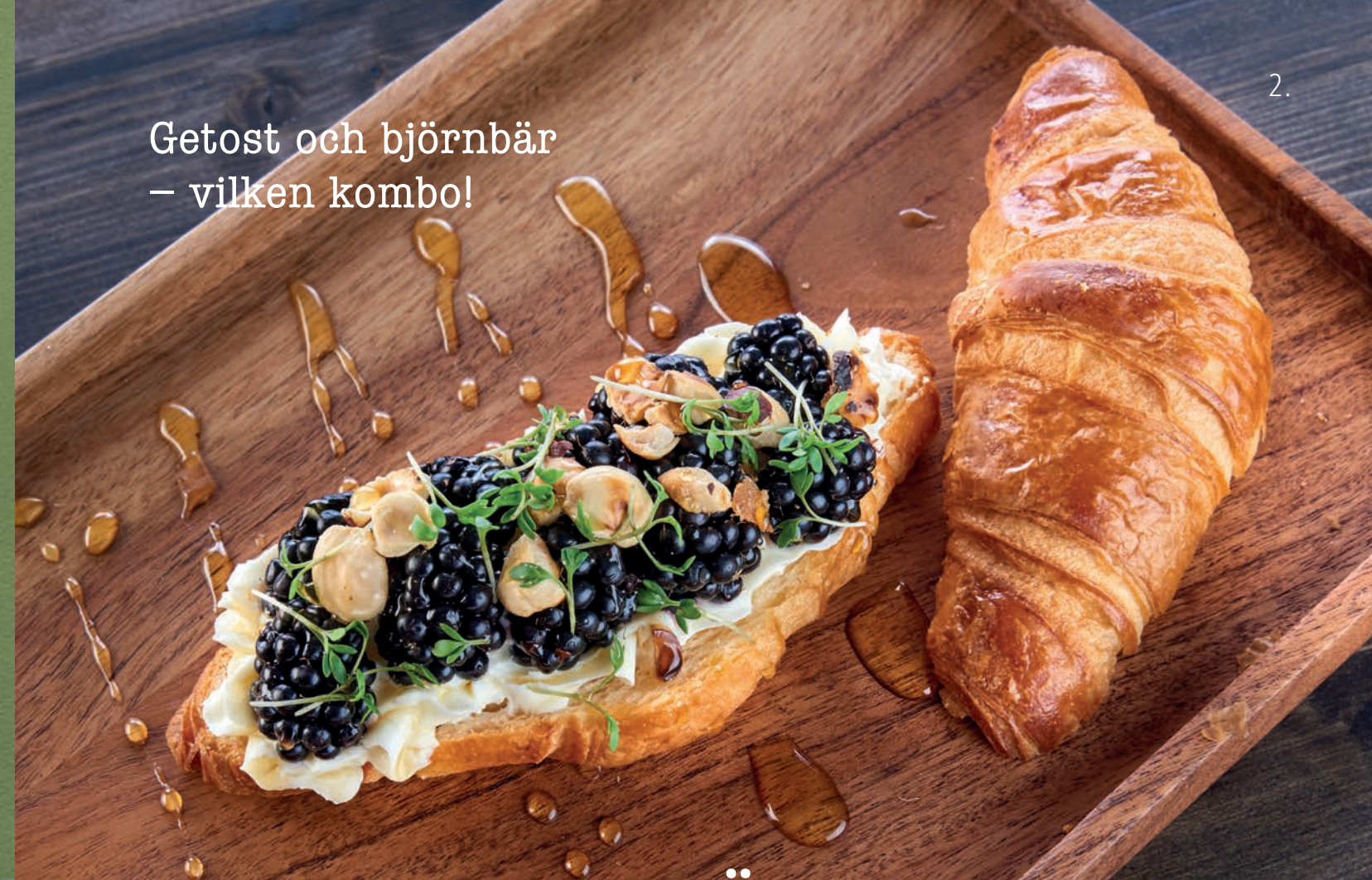
2. Getost och björnbär – vilken kombo!