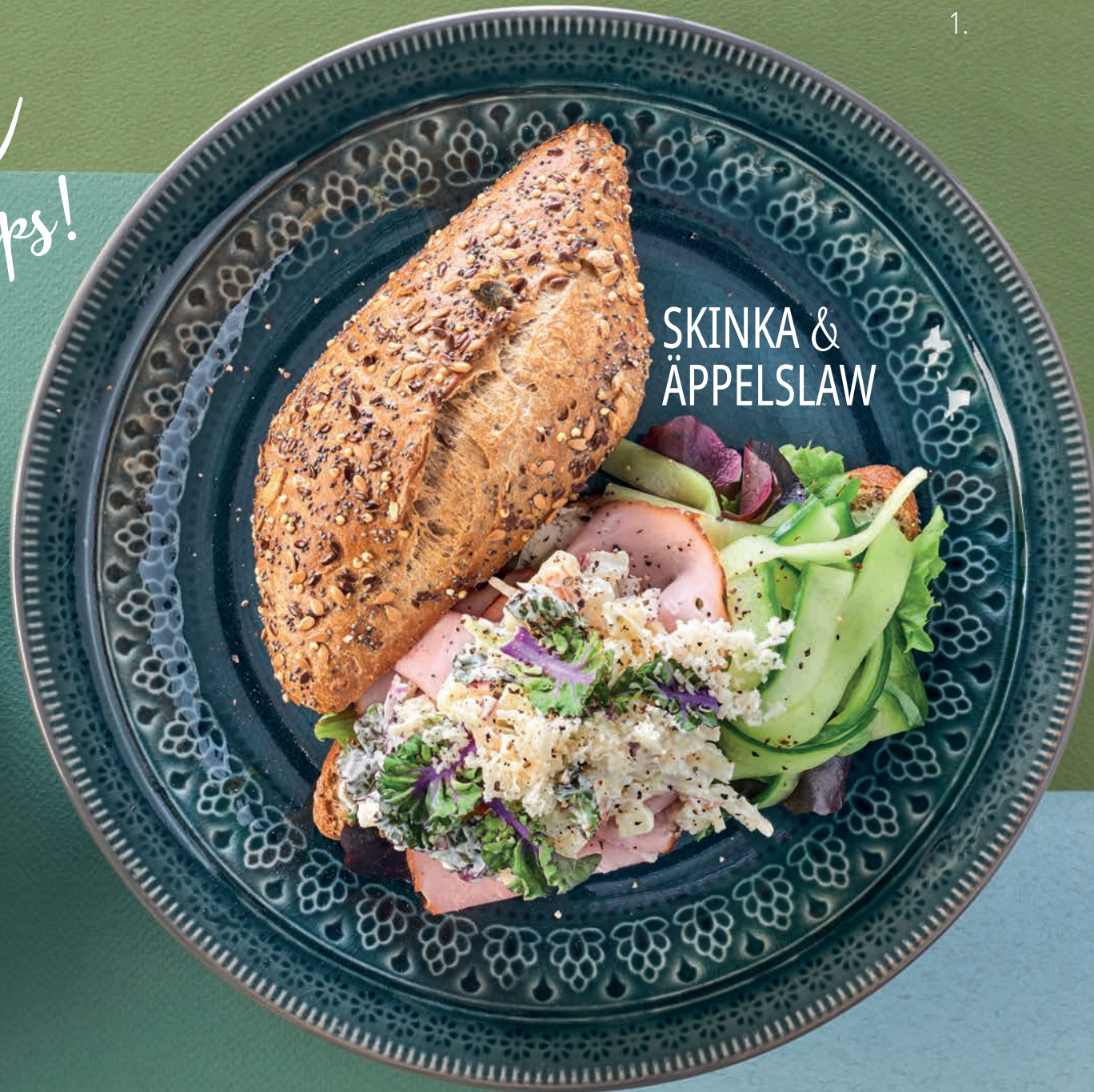
1. SKINKA & ÄPPELSLAW