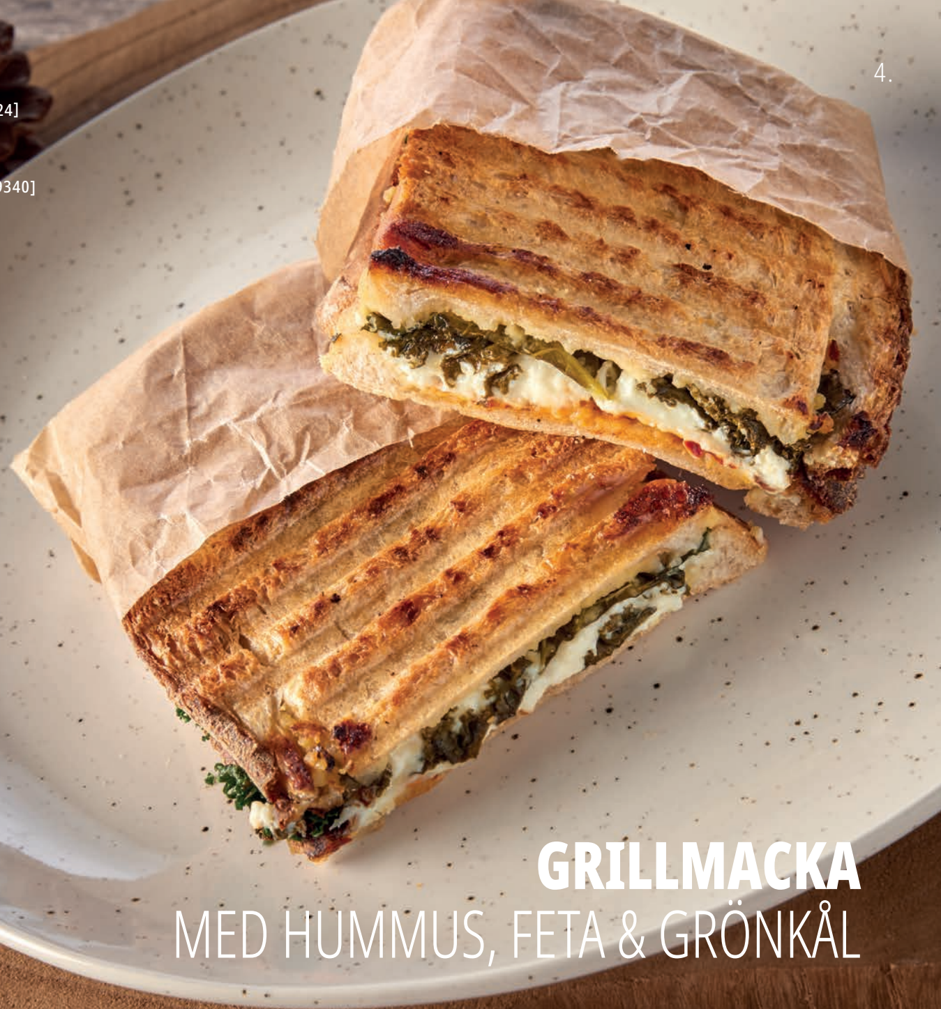
GRILLMACKA MED HUMMUS, FETA & GRÖNKÅL