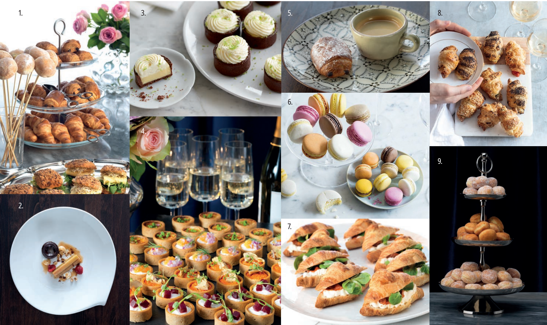
1. CROISSANTKLASSIKER MINI MIXLÅDA [S2454] 2. CHOKLADFONDANT MINI [74672] 3. SKAL CHOKLAD [78448] 4. SKAL SNACKS [78453] 5. PAIN AU CHOCOLAT MINI [S1636] 6. MAKRONER I SEX OLIKA SMAKER [78460] 7. CROISSANT MINI [S3189] 8. CROISSANT SAVOURY MINI MED TRE OLIKA Fyllningar [18282] 9. MINIMUNKAR I SEX OLIKA SMAKER

Vårt fullsortiment av läckra minisar hittar du på delifrance.se